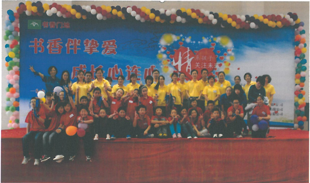
书香门地心连心活动现场

该活动通过体验式的游戏环节，帮助孩子自我洞察，自我学习，提高沟通能力；帮助家长了解孩子的内心世界，学会欣赏和支持；帮助老师了解每个孩子的性格特点，是对现下应试教育环境中素质教育缺失的重要补充。